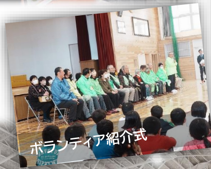
ボランティア紹介式