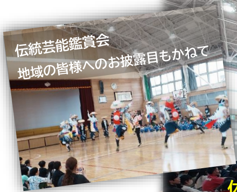
伝統芸能鑑賞会 地域の皆様へのお披露目もかねて