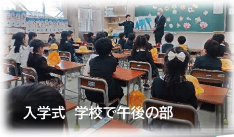
入学式 学校で午後の部