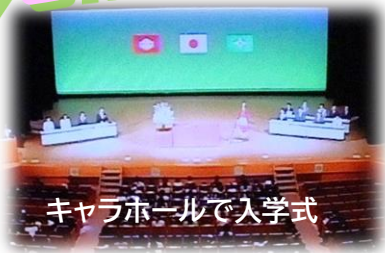
キャラホールで入学式