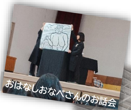
おはなしおなべさんのお話会